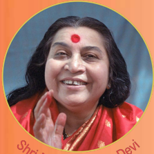
Shri Mataji Nirmala Devi