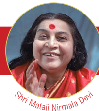
Shri Mataji Nirmala Devi