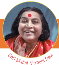
Shri Mataji Nirmala Devi