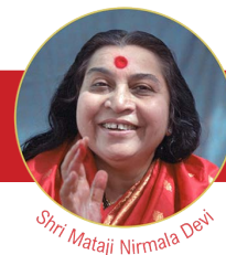
Shri Mataji Nirmala Devi