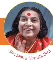
Shri Mataji Nirmala Devi