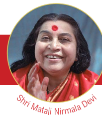
Shri Mataji Nirmala Devi