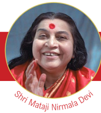
Shri Mataji Nirmala Devi