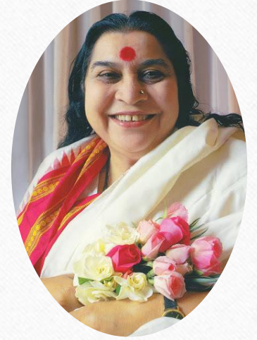
Shri Mataji Nirmala Devi