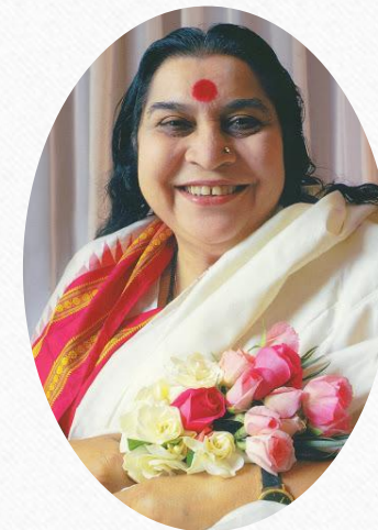
Shri Mataji Nirmala Devi