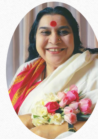
Shri Mataji Nirmala Devi