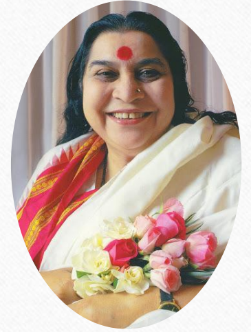
Shri Mataji Nirmala Devi