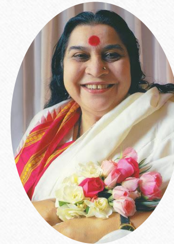
Shri Mataji Nirmala Devi