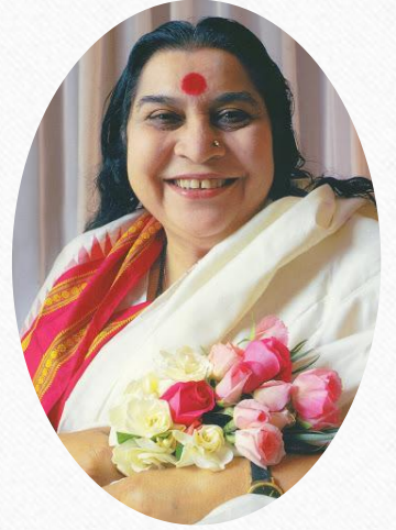
Shri Mataji Nirmala Devi