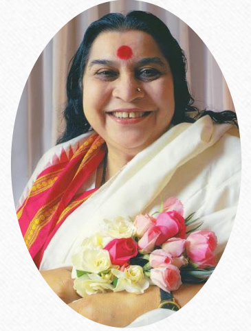
Shri Mataji Nirmala Devi